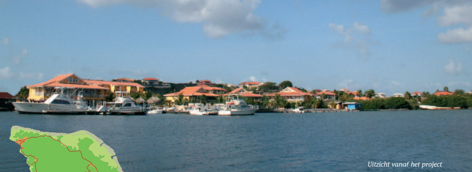
Uitzicht vanaf het project